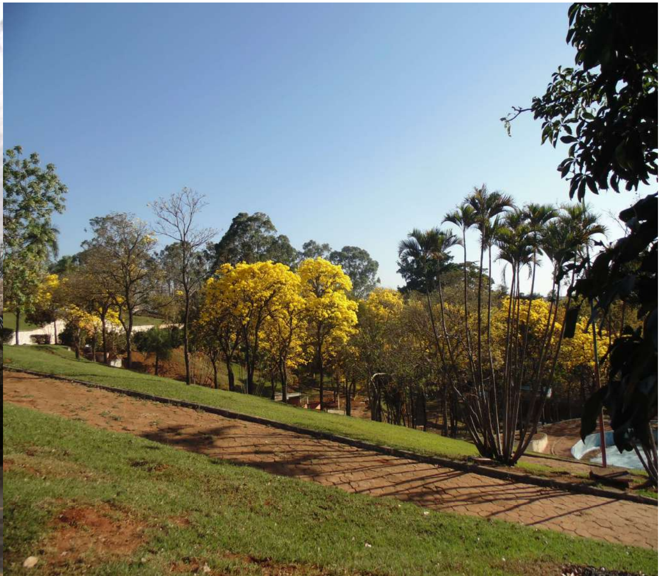
Ipês em florada na área urbana da cidade (Branco ( Tabebuia roseo-alba ) e Amarelo ( Handroanthus albus ))