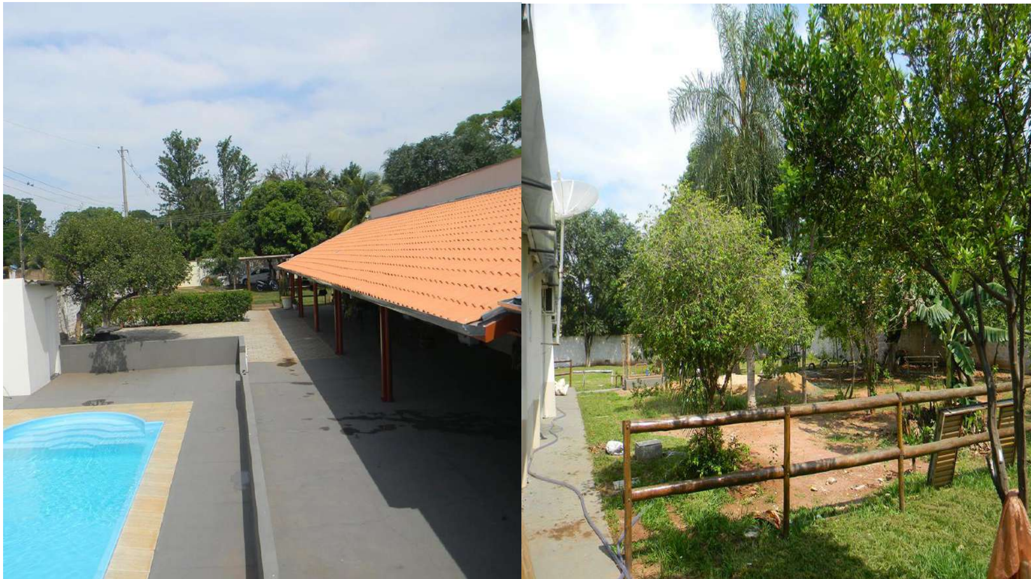
Chácara Bonellis – Rota Turística Centro – Bairro Helvécia