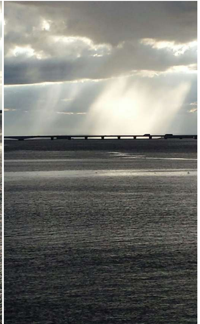
Rio Paraná – Reservatório da Usina Hidroelétrica e Eclusa “Engenheiro Sergio Mota” - Temporal