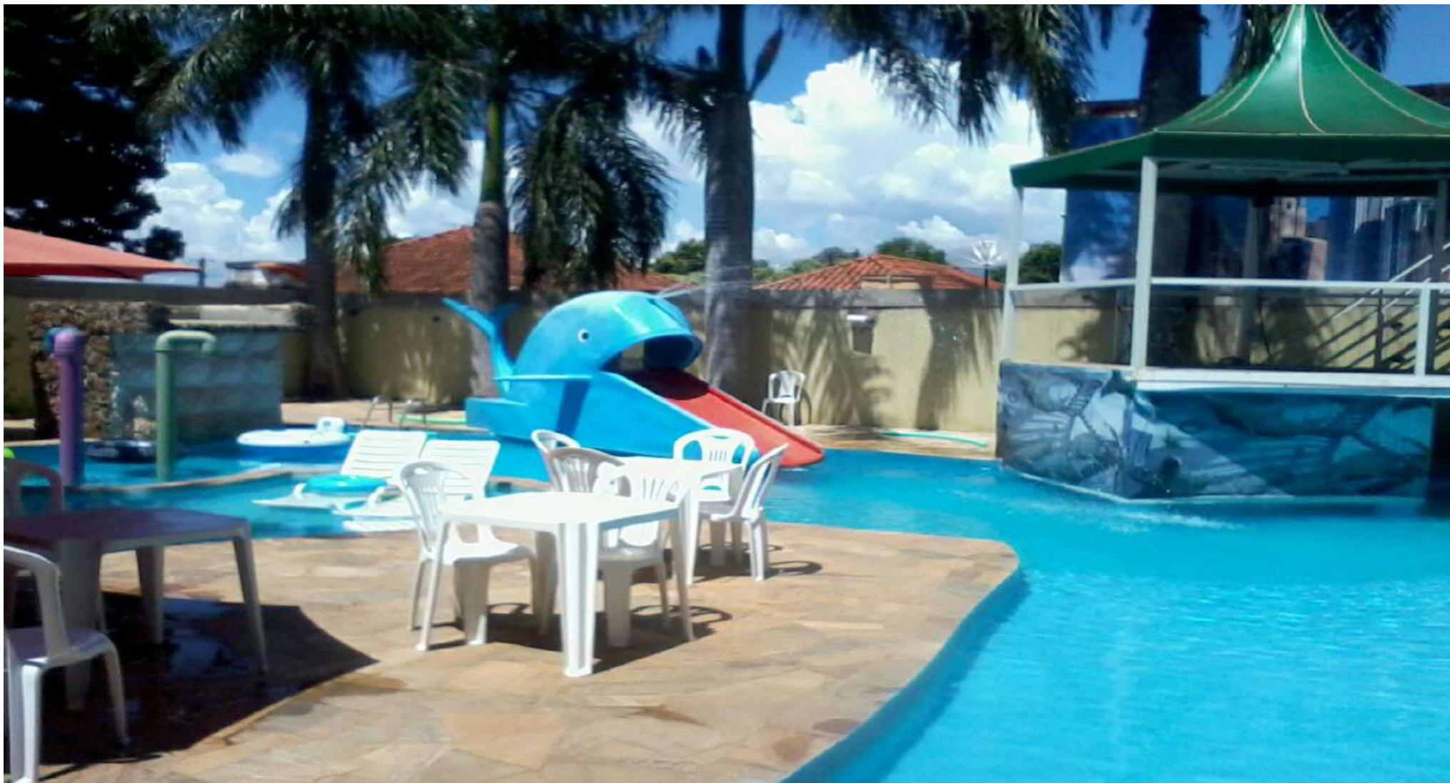
Hotel Itaverá - Centro