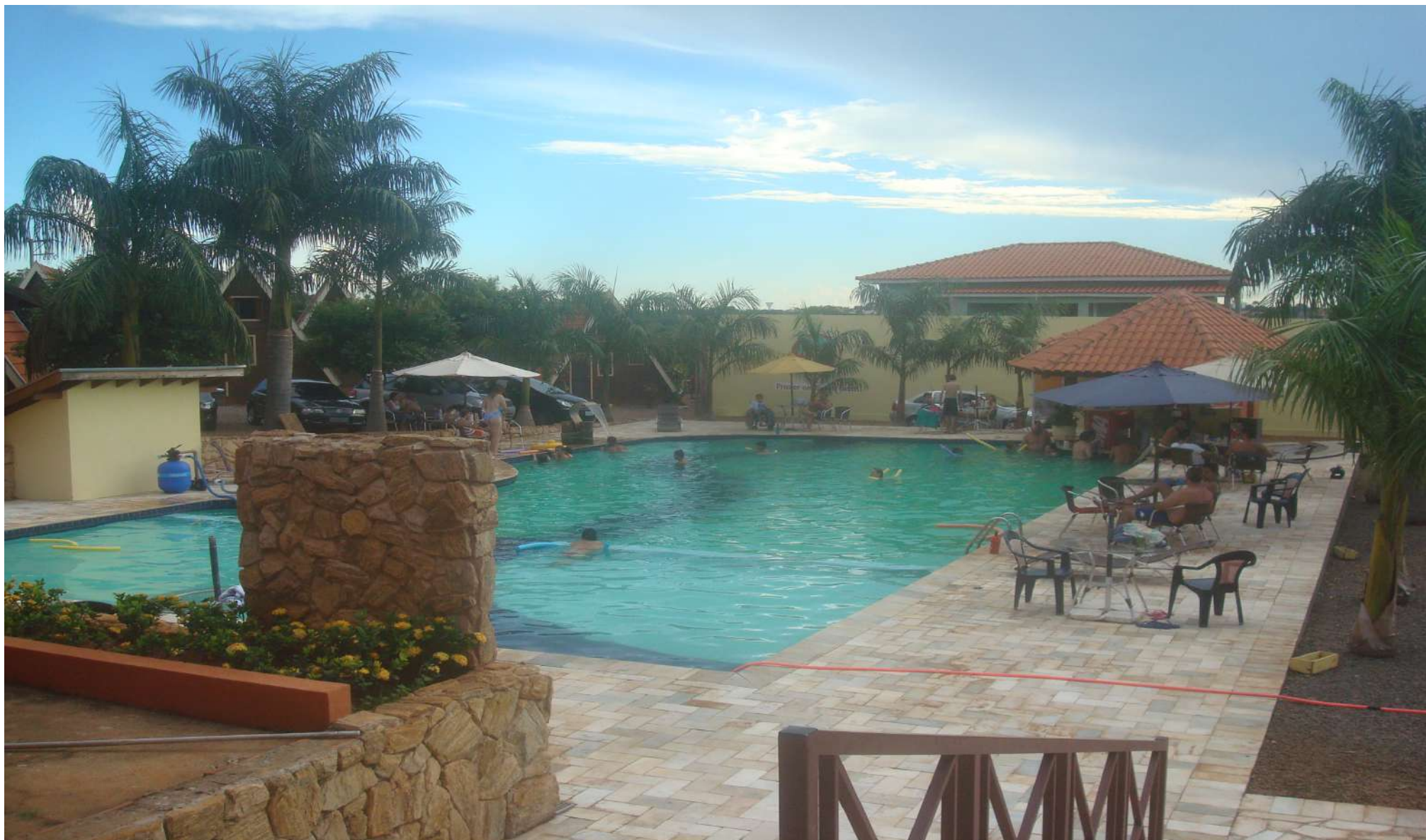
Pousada Mãe D'Água – Rota Turística Noroeste