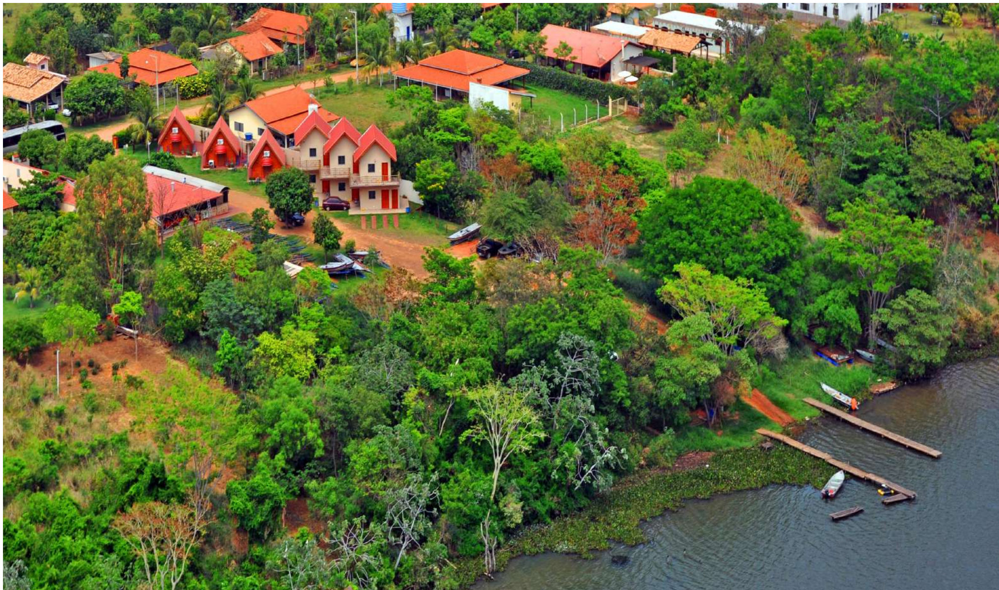
Pousada Sossego – Rio do Peixe – Campinal – Rota Turística Norte