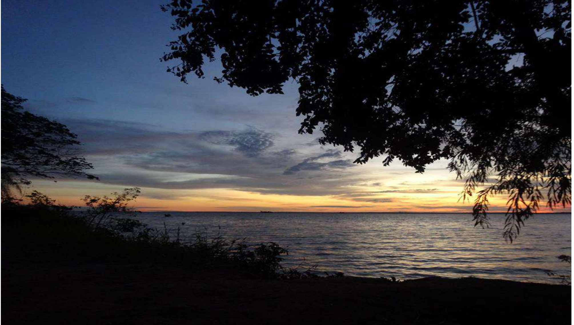
Orla Fluvial de Presidente Epitácio – Início do Crepúsculo