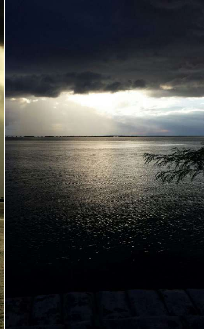
Rio Paraná – Reservatório da Usina Hidroelétrica e Eclusa “Engenheiro Sergio Mota” – Por do Sol e Amanhecer