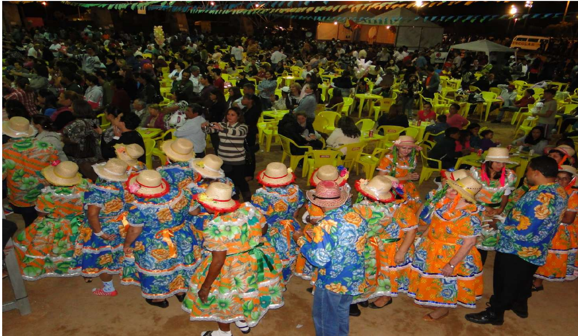
São João – São Pedro - fogueirão