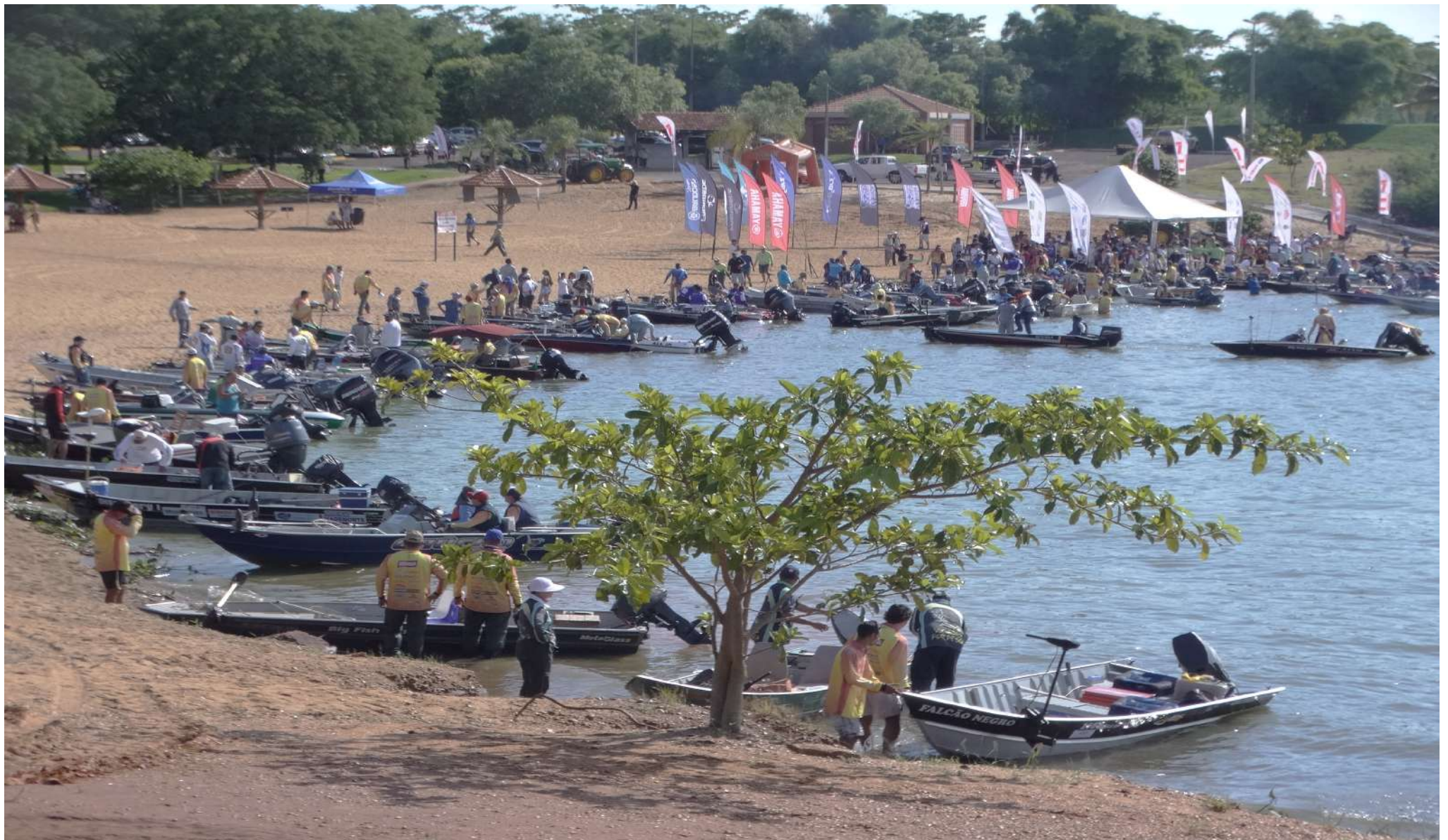
Praia – Parque Municipal “O Figueiral” – Torneio de Pesca Amadora Esportiva ao Tucunaré