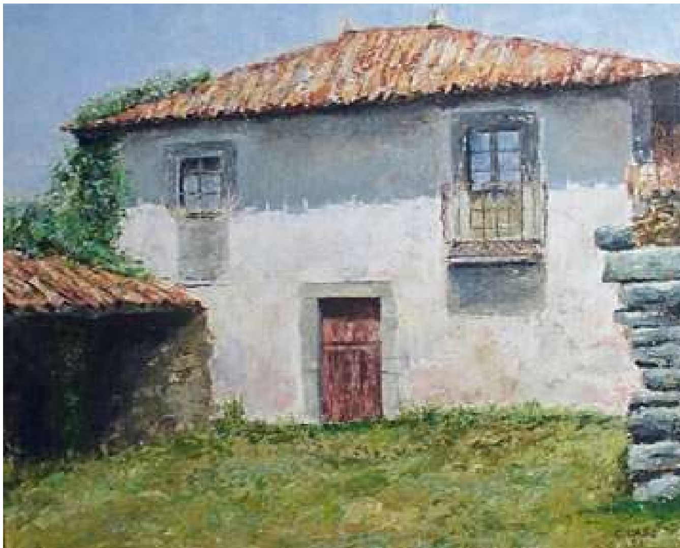
Estalagem – pintura a óleo – Carlo Cabo