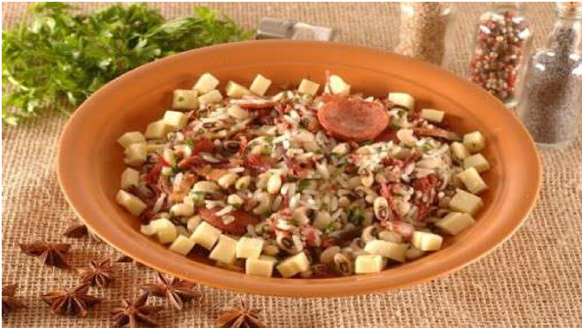
Reviro – tradicional comida dos colonizadores alemães no estado do Paraná