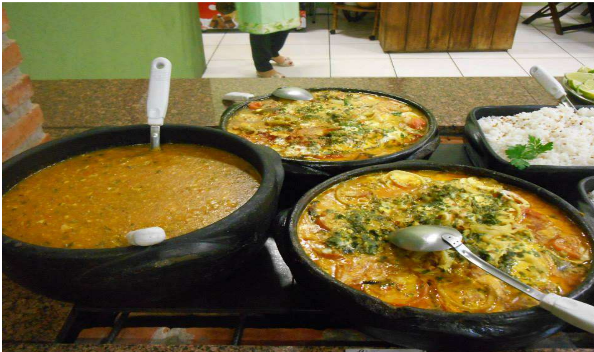
Peixada Completa – Diversos tipos de cozinha baseado em peixes de água doce