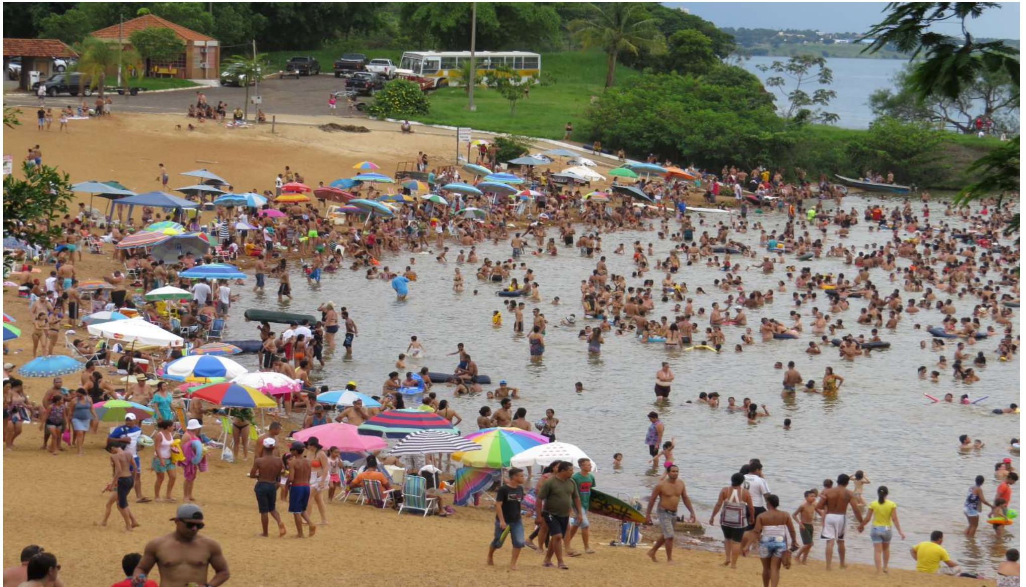
Praia Fluvial – dia de final de semana / feriado