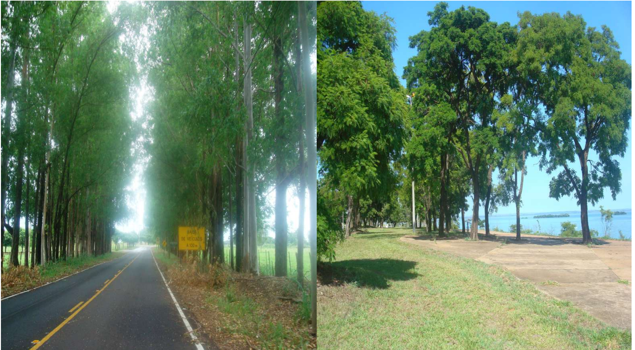
Corredor de espécies vegetais – Coluna de eucaliptos ( Eucalyptus ) – distrito do industrial / Angicos ( Anadenanthera spp. ) – Parque da Orla fluvial - centro