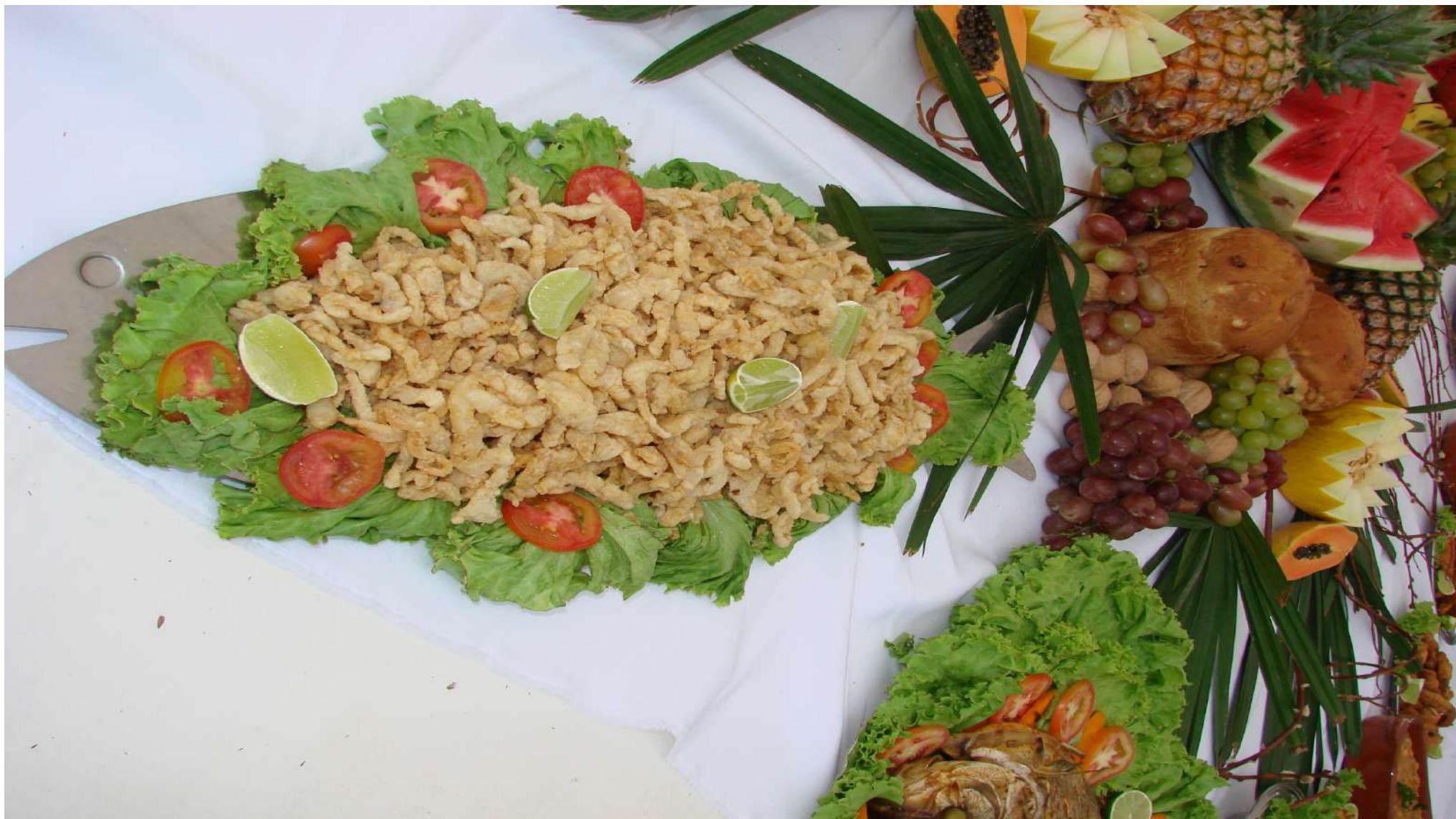
Torresminho de Peixe – Adaptação entre peixes do rio das espécies: Piau, Acara, Tilápia e Pacu