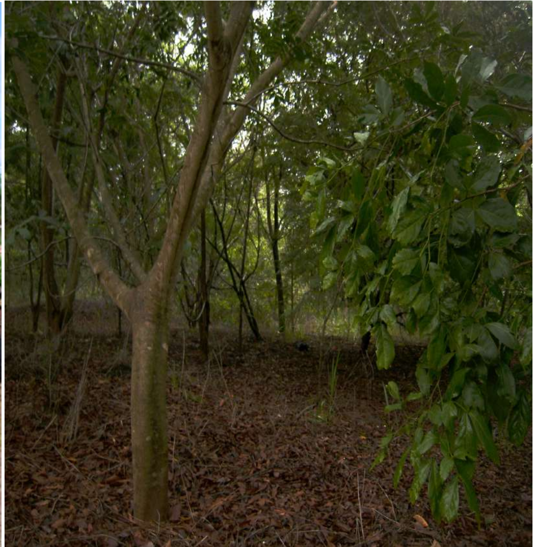
Reserva de Preservação Ambiental “Córrego do Veados” – Viveiro de Mudanças – Área de Recuperação consolidada.