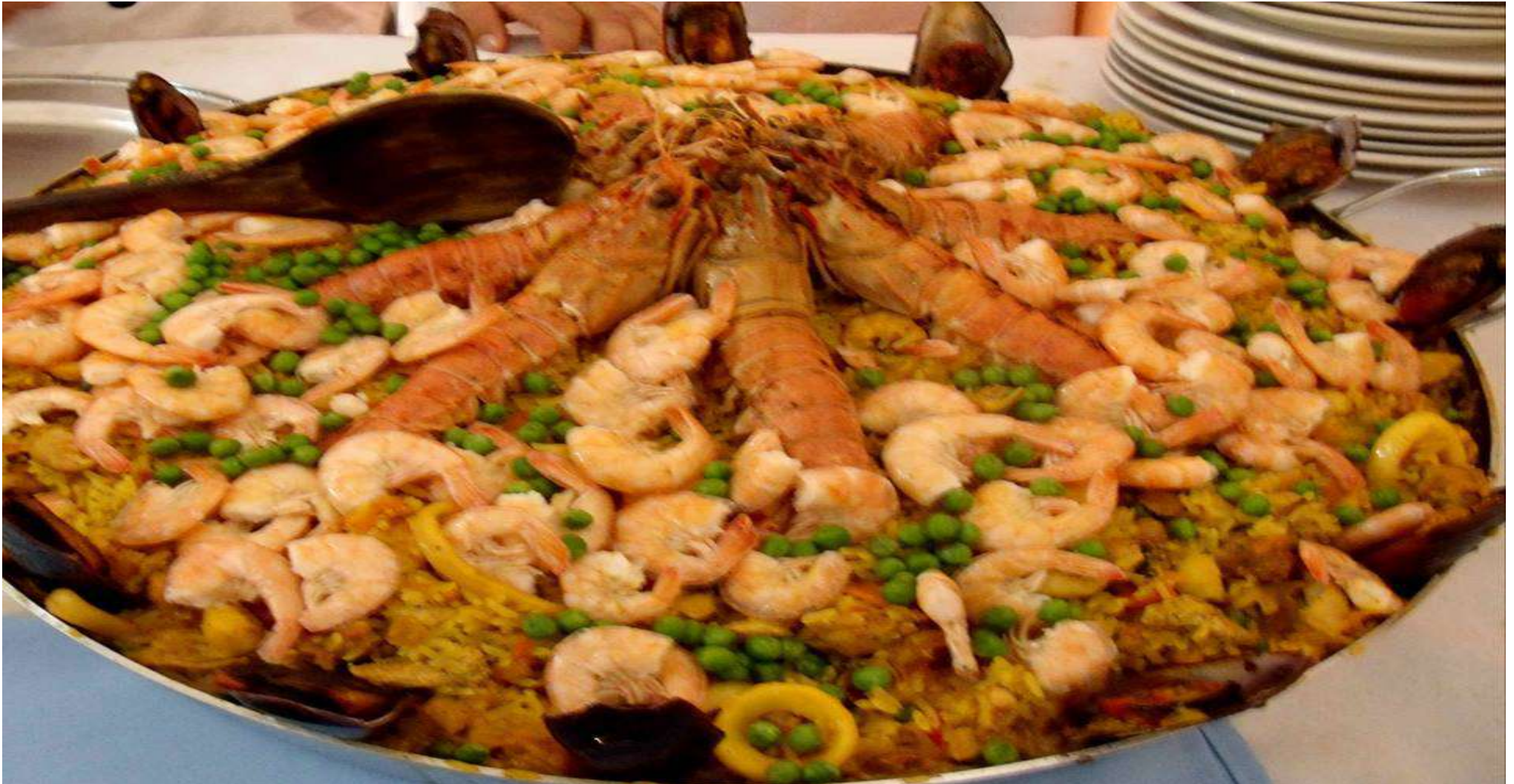
Paella – Origem Espanhola com mistura entre peixe e frutos do mar e rio – adaptação Pousada Recanto do Tucunará – Rota Turística Sul