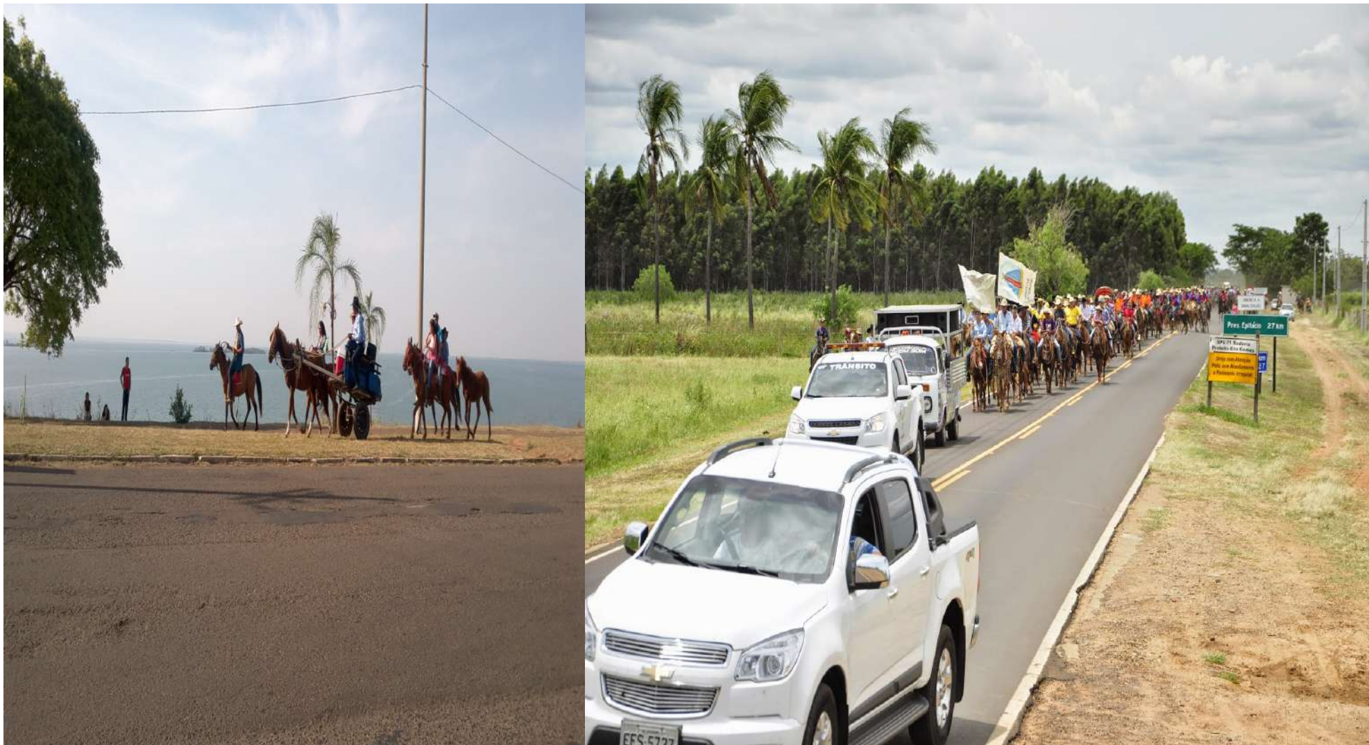
Cavalgada de São Sebastião