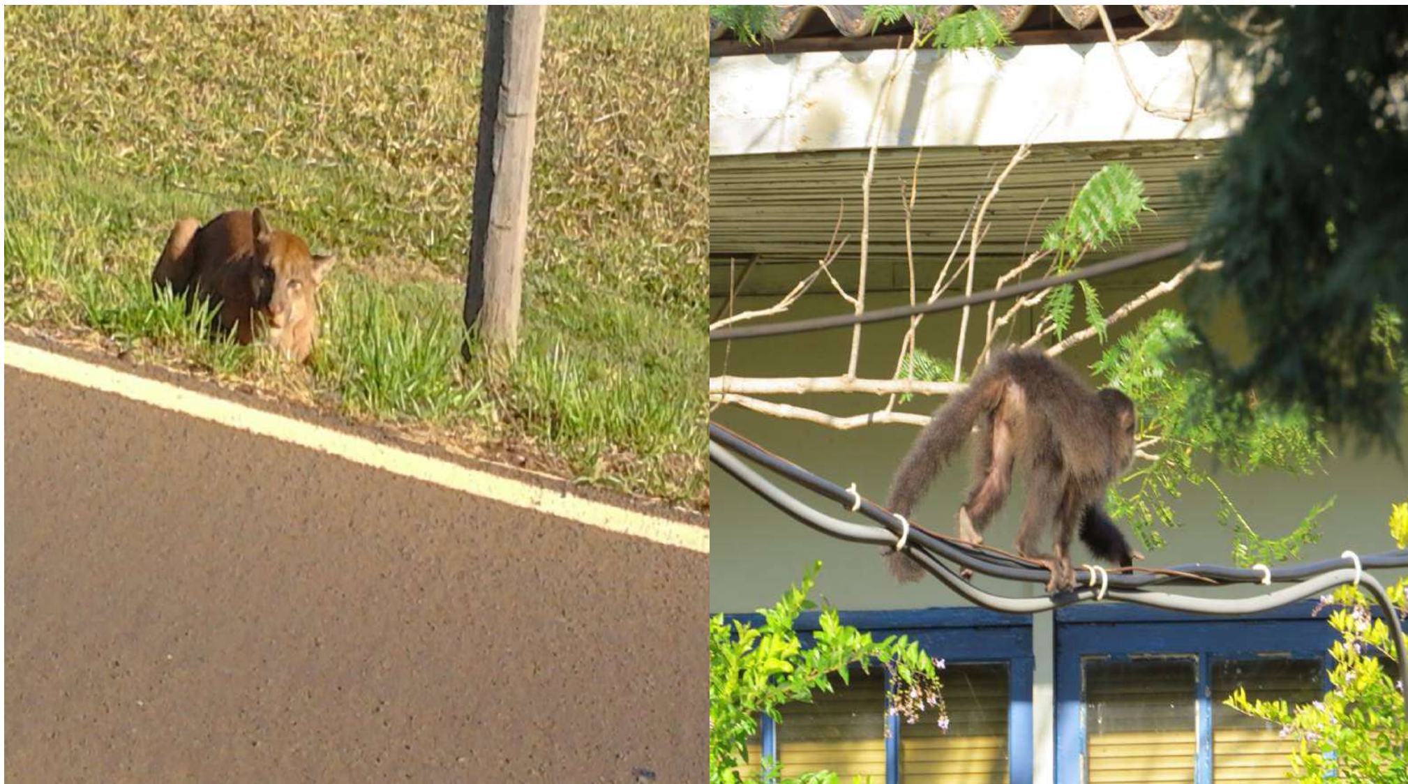
Animais selvagens – Onça Suçuarana ( Puma concolor ) – Macaco bugio ( Alouatta )