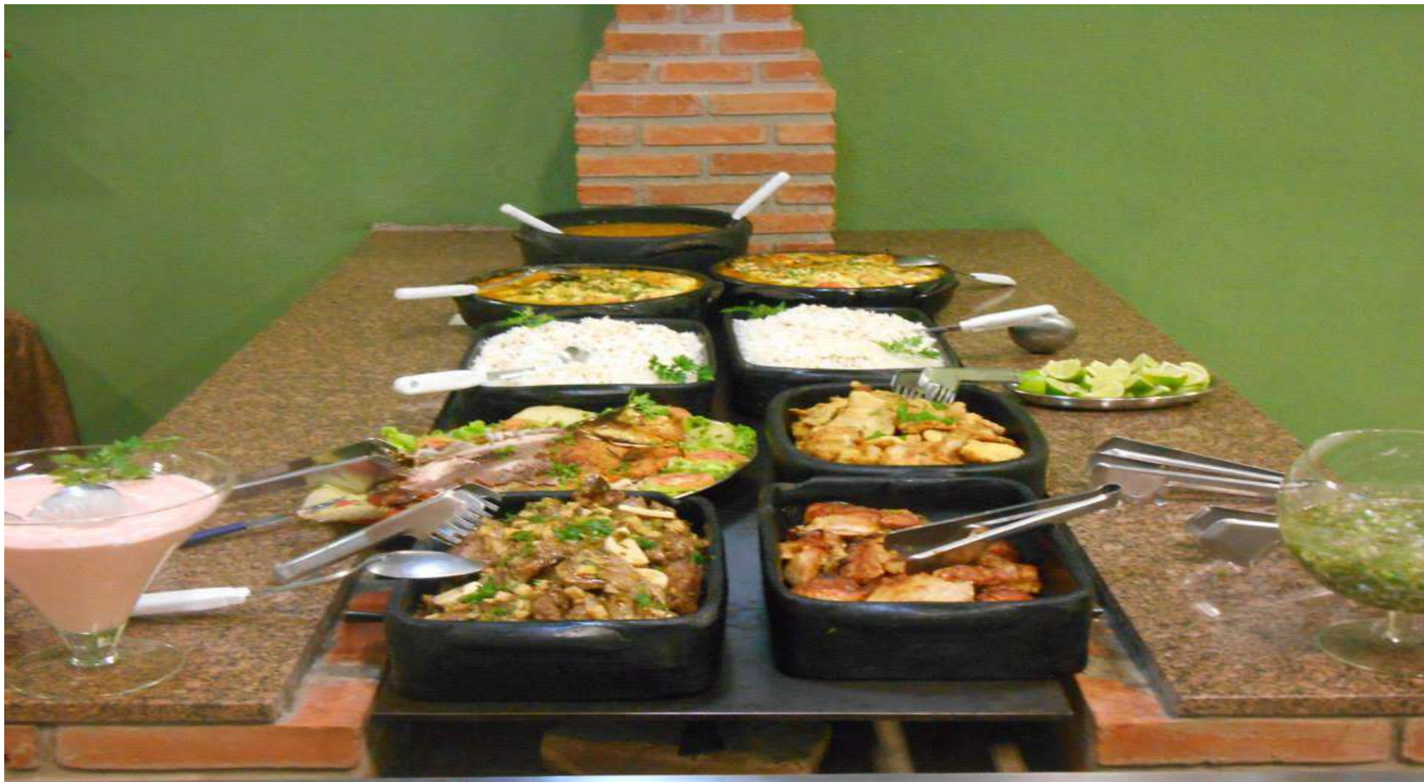
Cozinha mineira servida diariamente em restaurante local.