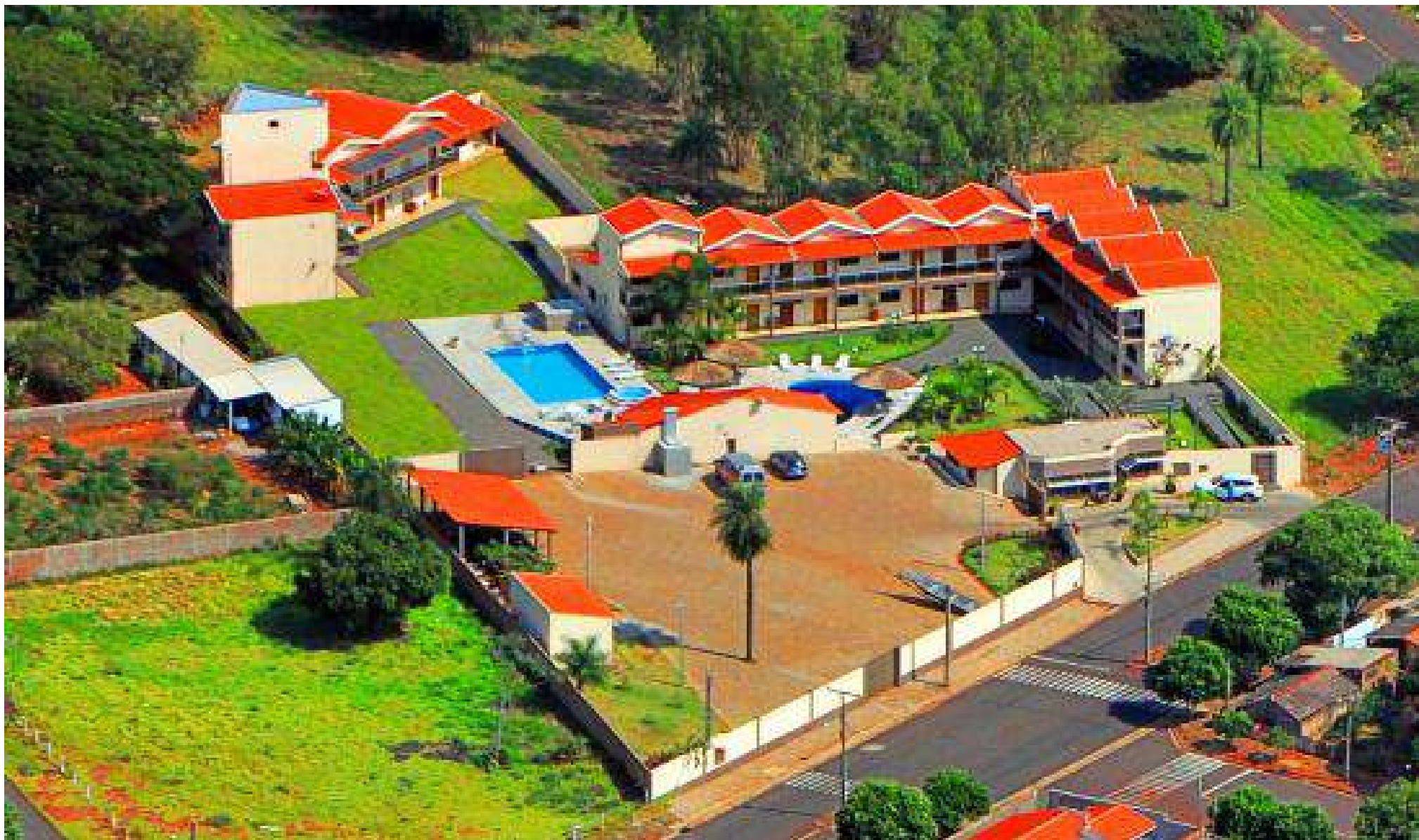
Pousada Orla do Sol – Centro da Cidade – Parque da Orla Fluvial