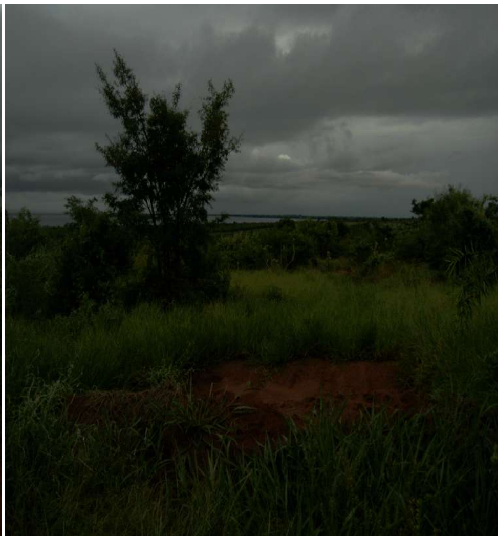
Reserva Proteção Ambiental “Córrego do Veado” – Áreas em Recuperação