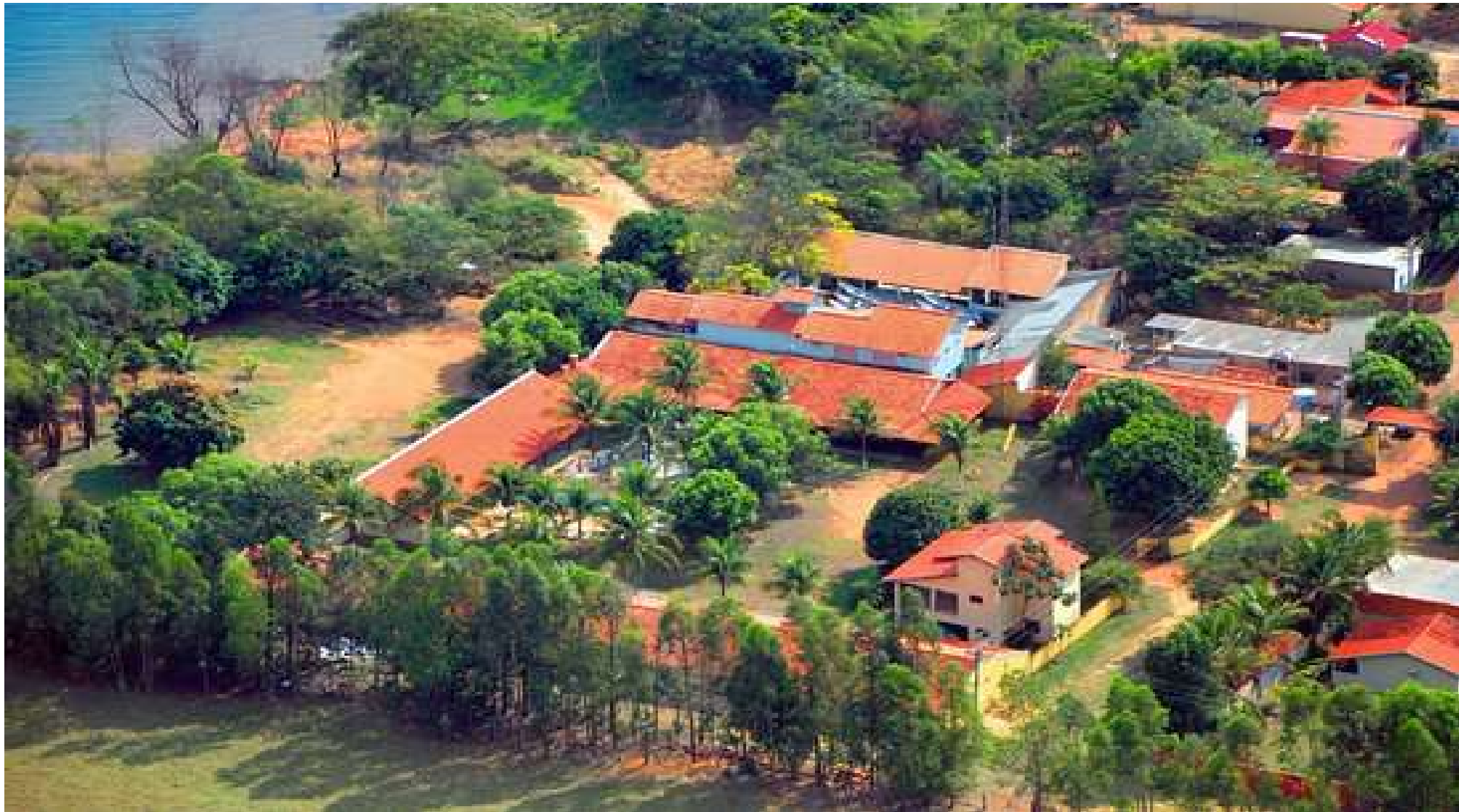
Pousada Cururu – Rota Turística Sul