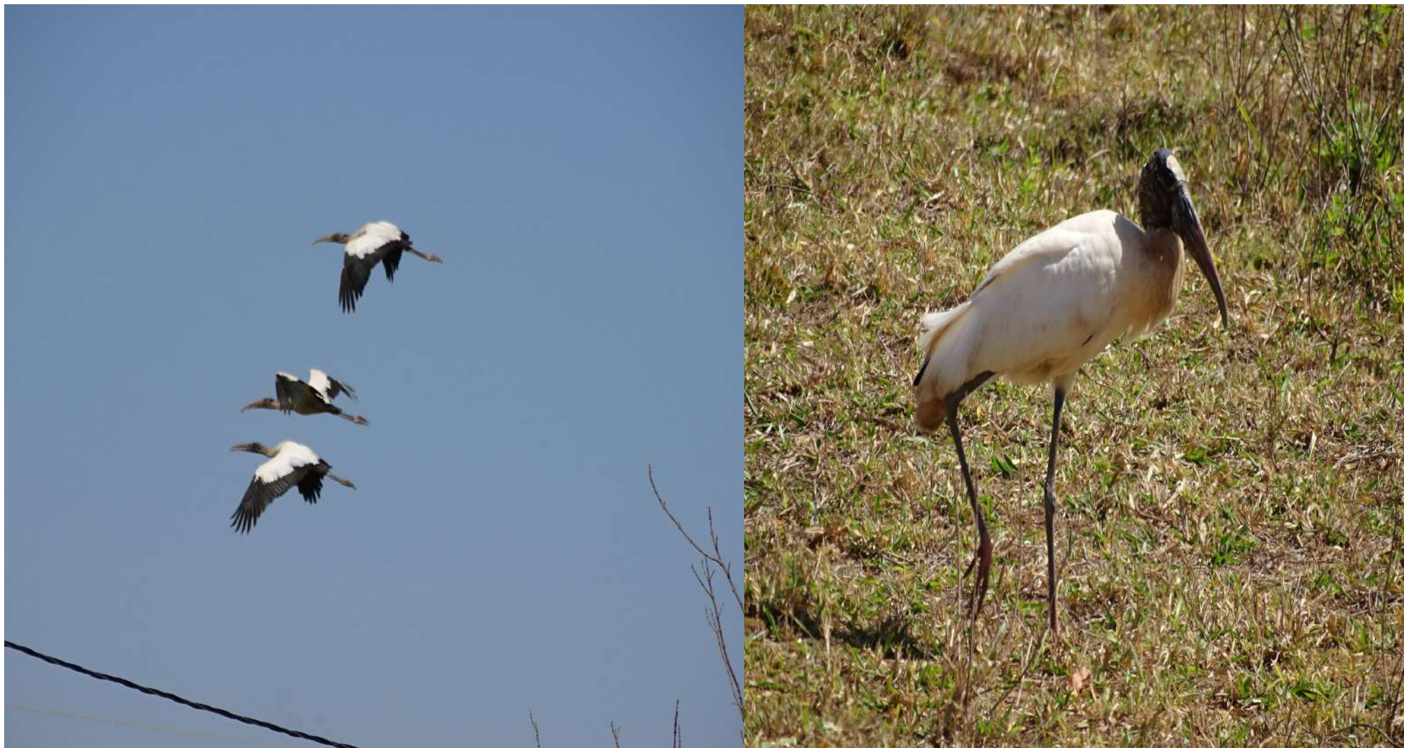
Aves (migratórias pantaneiras – Cegonha do Pantanal, Tuiuiú (jaburu))