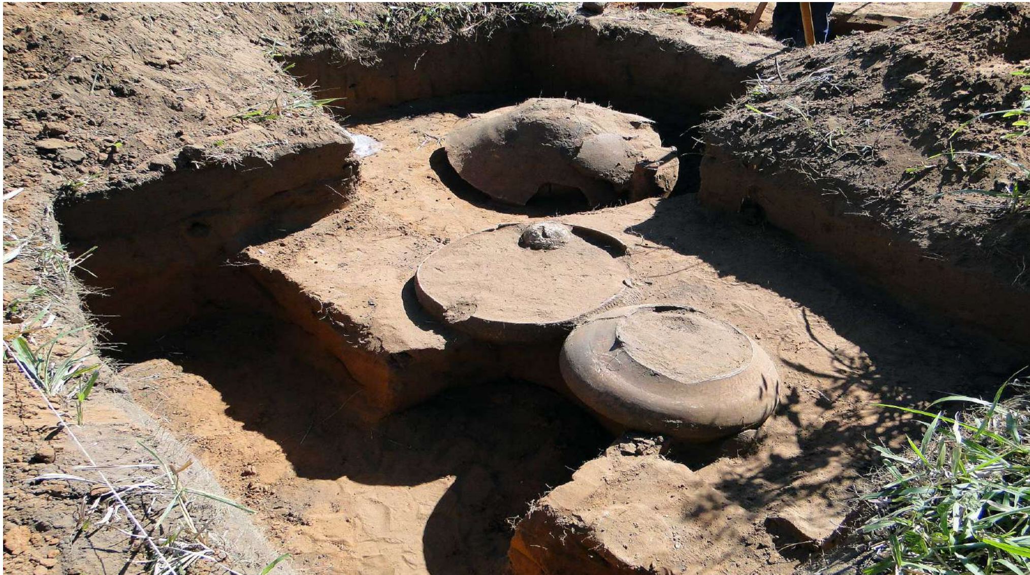
Urnas funerárias indígenas migratórias – Rota Turística Norte – Rio Paraná x Córrego do Veado