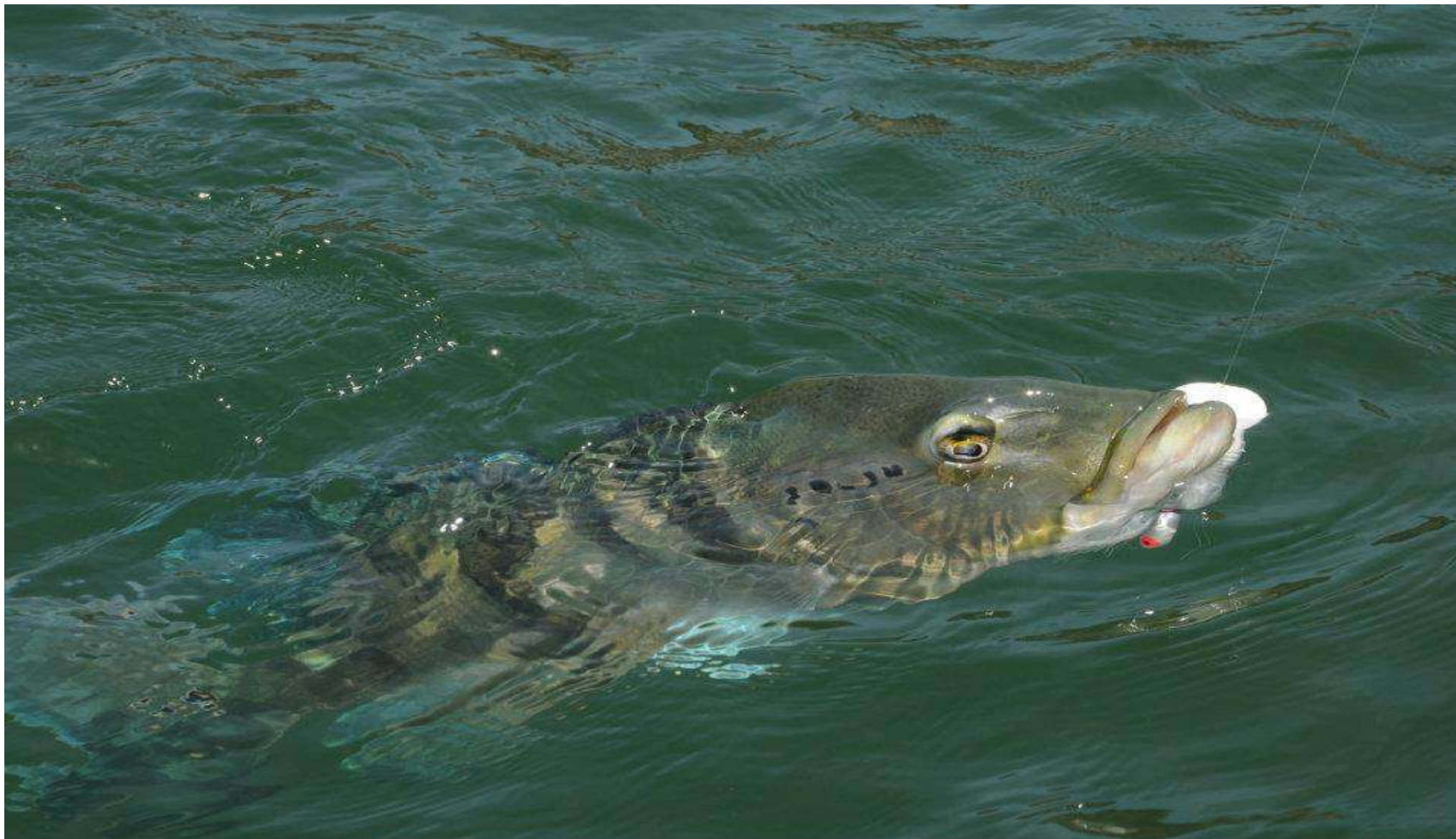
Tucunaré – Azul ( Cichla piquiti ) – peixe esportivo de origem amazônica que se estabeleceu no Rio Paraná após formação do reservatório – Embaixador do Turismo na Estância Turística de Presidente Epitácio