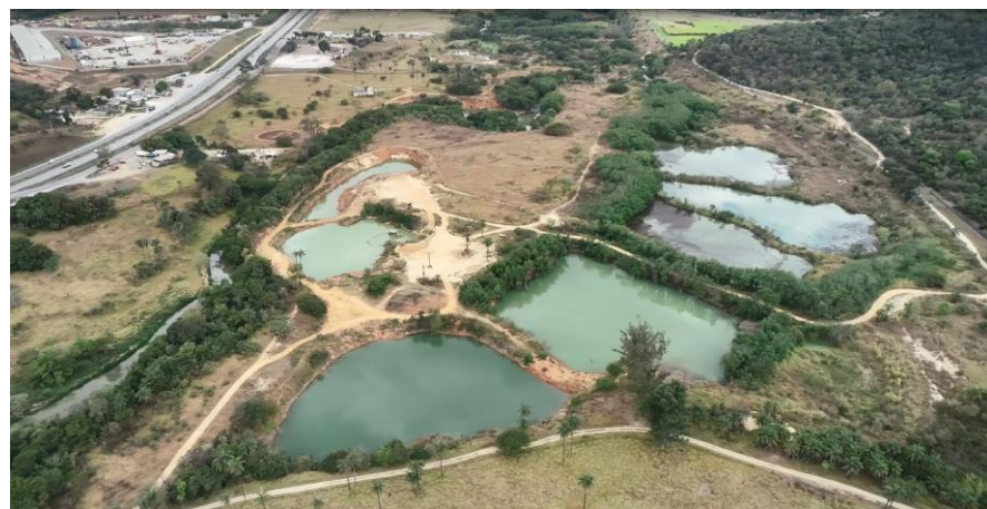
Local do empreendimento