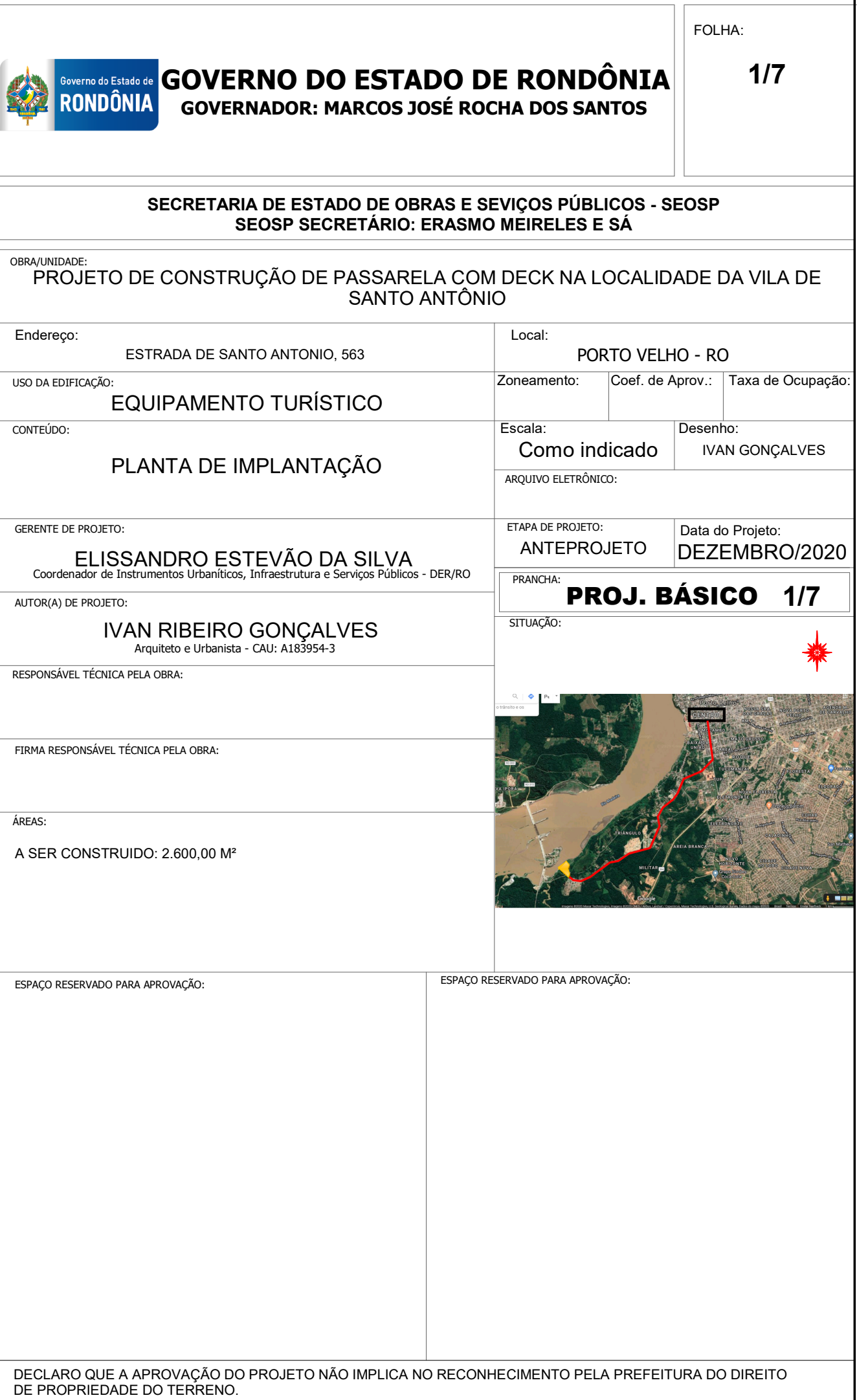
1 PLANTA DE IMPLANTAÇÃO 1 : 500